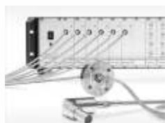
Контроль эмиссии плазмы