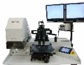
Установка совмещения и экспонирования фоторезиста