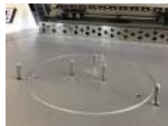
Подъемные пины из мягкого материала