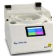
Установка нанесения фоторезиста