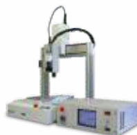
Робот для лазерной пайки