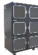
Шкафы сухого хранения