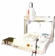
Настольный дозирующий робот