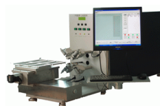
Лазерная зачистка проводов и кабелей