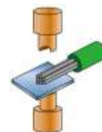
Контактная и ультразвуковая сварка

Гарантия правильности выбора автоматизированного решения для обработки проводов/кабелей - анализ фактических образцов материала, требуемого к обработке. Компания «Евроинтех» рекомендует предоставлять образцы проводников перед непосредственным выбором оборудования.