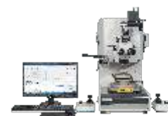
Установки тестирования проволочных соединений

Eurointech СОВРЕМЕННЫЕ РЕШЕНИЯ ДЛЯ ПРОИЗВОДСТВА ЭЛЕКТРОНИКИ www.eurointech.ru