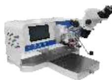
Ручные установки микросварки