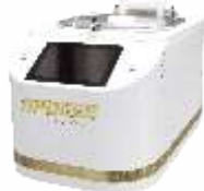
Установка нанесения фоторезиста