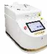
Установка сушки фоторезиста