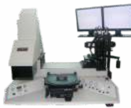
Установка совмещения и экспонирования