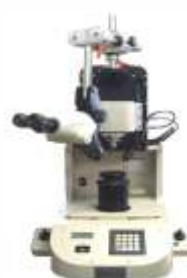
Тестер механических соединений