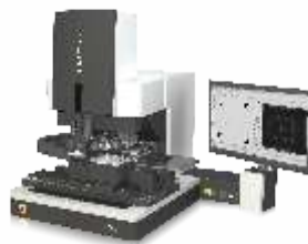
Установка монтажа кристаллов