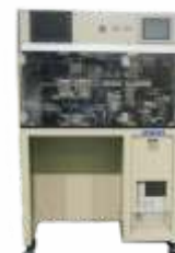
Полуавтоматическая установка укладки/прихватки крышек