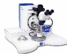
Установка ультразвуковой микросварки