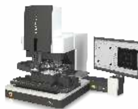
Установка монтажа кристаллов