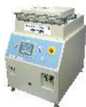
Вакуумная печь для отжига