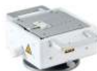
Нагревательные столики различной формы и размеров