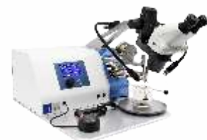
Установка микросварки TPT HB05

Eurointech СОВРЕМЕННЫЕ РЕШЕНИЯ ДЛЯ ПРОИЗВОДСТВА ЭЛЕКТРОНИКИ www.eurointech.ru