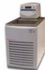
Системы температурного регулирования