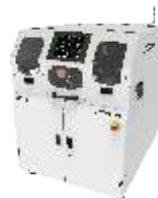
Установки плазменной обработки поверхности