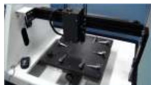
Нагрев рабочего столика до 150°C