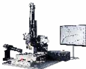
Установка монтажа кристаллов