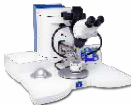
Установка ультразвуковой микросварки