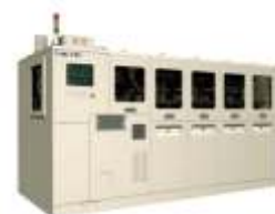
Установка корпусирования микросхем