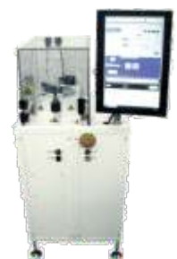
Установка травления кремния и оксида кремния

Eurointech СОВРЕМЕННЫЕ РЕШЕНИЯ ДЛЯ ПРОИЗВОДСТВА ЭЛЕКТРОНИКИ www.eurointech.ru