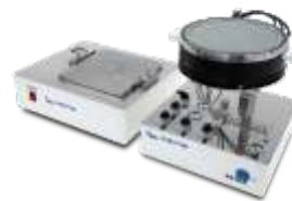
Установка монтажа пластин