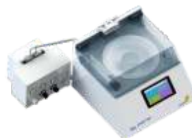
Установка нанесения адгезива