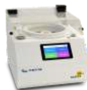
Установка проявления фоторезиста