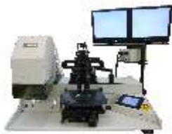
Установка совмещения и экспонирования фоторезиста