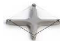
Держатели для подложек