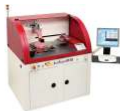
Установка сортировки кристаллов