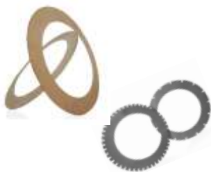
Резиноидные, металлические, остеклованные и др. диски