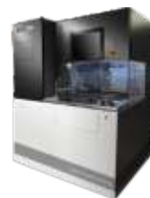
Дисковая резка пластин