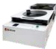
Установка монтажа пластин на ленту-носитель