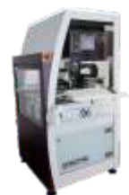
Автоматическая установка монтажа кристаллов