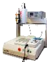
Дозирующий робот с шнековым дозатором