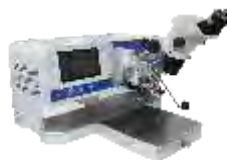
Ручные установки микросварки