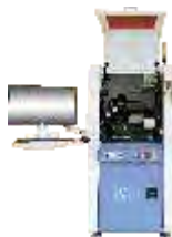
Автоматические установки микросварки