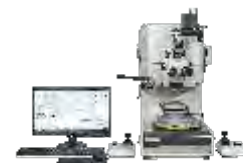
Установки тестирования проволочных соединений