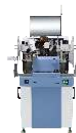
Установки ультразвуковой микросварки

Eurointech СОВРЕМЕННЫЕ РЕШЕНИЯ ДЛЯ ПРОИЗВОДСТВА ЭЛЕКТРОНИКИ www.eurointech.ru