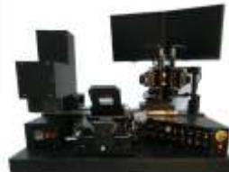
Установки экспонирования и совмещения