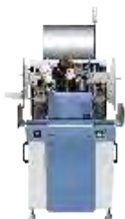
Автоматические установки микросварки