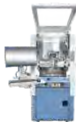
Автоматические установки монтажа кристаллов