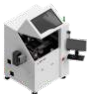
Установки микромонтажа кристаллов и компонентов