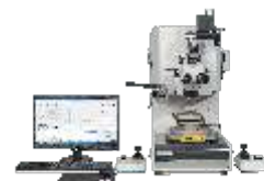
Установки тестирования проволочных соединений

Eurointech СОВРЕМЕННЫЕ РЕШЕНИЯ ДЛЯ ПРОИЗВОДСТВА ЭЛЕКТРОНИКИ www.eurointech.ru