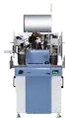
Автоматические установки микросварки