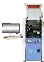
Автоматические установки микросварки