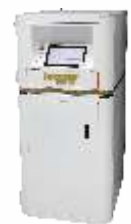
Установка демонтажа пластин