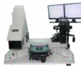
Установка совмещения и экспонирования