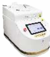
Установка сушки фоторезиста