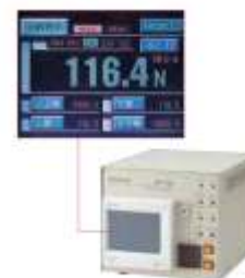
Модуль контроля усилия прижима