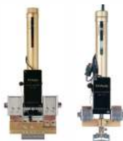
Различные типы сварочных голов