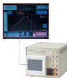
Модуль контроля толщины припоя