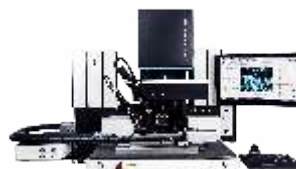
Высокоточные установки монтажа и ремонта