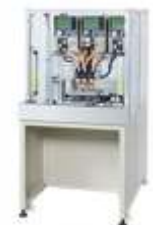
Комплексные решения AVIO