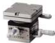
Рабочий столик с регулировкой по трем осям