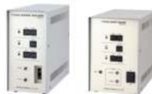
Различные типы трансформаторов