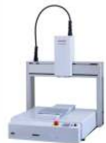
Настольный робот для управления сварочной головкой