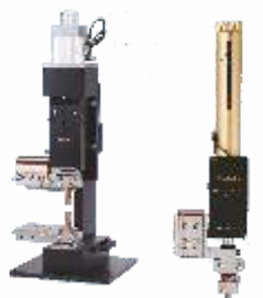
Различные типы сварочных головок