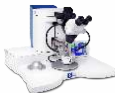
Установка ультразвуковой микросварки