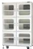
Шкаф сухого хранения