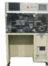
Полуавтоматическая установка укладки/прихватки крышек