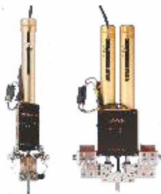
Различные типы сварочных головок