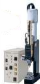
Моторизованный привод перемещения электрода