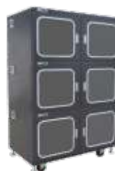
Шафы сухого хранения