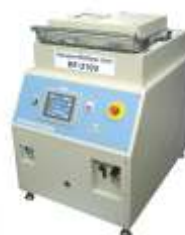
Печь оплавления припоя