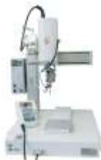
Настольные паяльные роботы