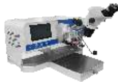
Ручные установки микросварки